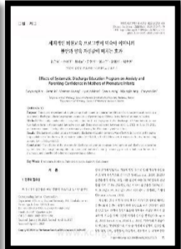
JCEN저널 NICU 임초연