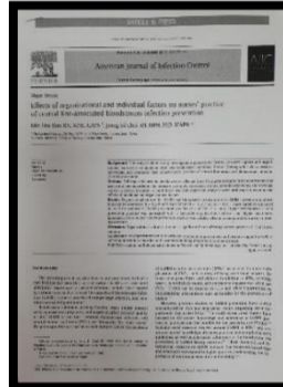
AJIC저널 인공신장실 김민희