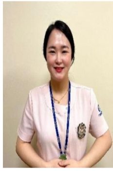
피부과 외래 황솔