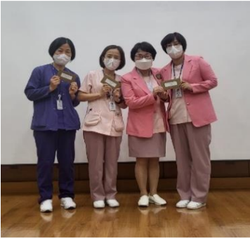
A168, I116 TICU