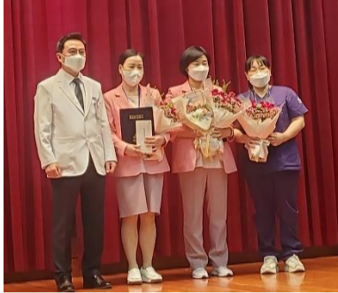
2023.1분기 C8B, I146 소화기내시경실