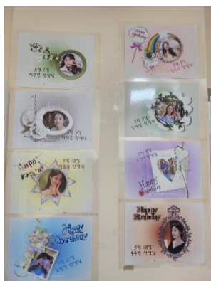
수술실 GWP 생일 축하