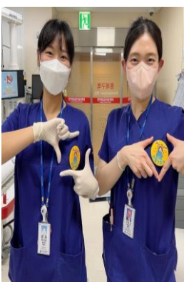
응급실 GWP CS 뱃지