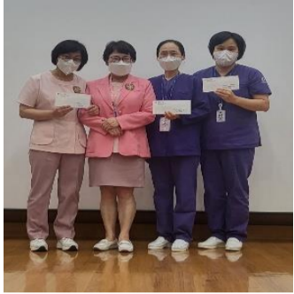
2022.4분기 MICU1, I156, 심혈관조영실