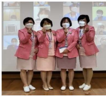
3분기:A168, 통원 4분기:A148, R7