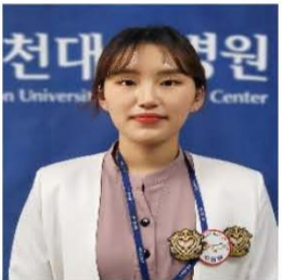
1월 C7A 오채을간호사