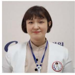
2월 I96 한보라간호사