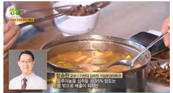
▶ 직업환경의학과 함승현 교수 KBS2 <생생정보> (11/20) 중금속 노출