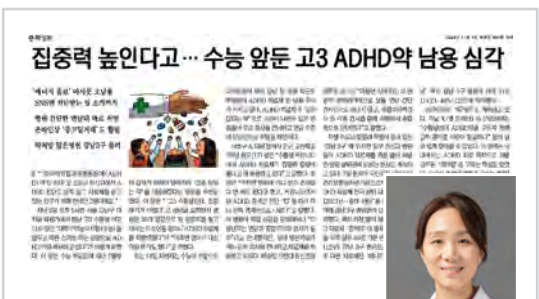
▶ 정신건강의학과 배승민 교수 문화일보 <ADHD약 남용 심각> (11/7) 미성년 ADHD는 종합적으로 판단해야