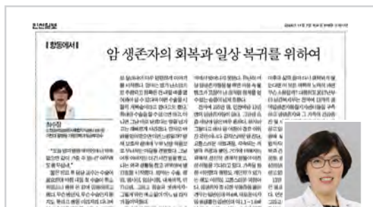
▶ 최수정 인천암생존자통합지원센터장 인천일보 <암 생존자의 회복과 일상 복귀> (11/7) 암생존자 235만명 시대