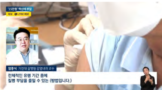
▶ 감염내과 임종식 교수 JTBC <뉴스> (11/25) 백일해 폐렴 독감 멀티데믹 우려