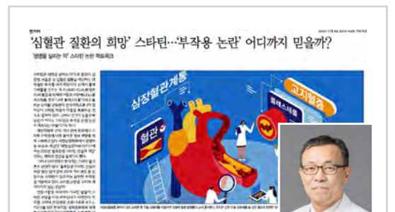
▶ 심장내과 정욱진 교수 한겨레 <스타틴 논란 팩트체크> (11/8) 스타틴 부작용 논란, 어디까지 믿을까